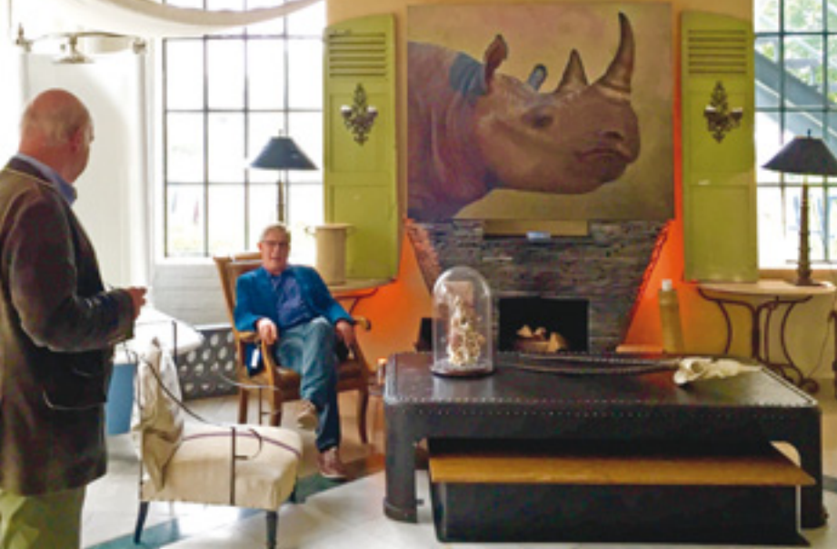
Die Ausstellung ist wie ein Wohnhaus eingerichtet. Alle Exponate sind käuflich.