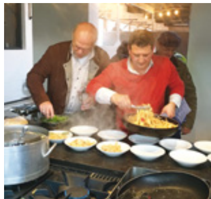
Anleitung eines Mitarbeiters, der sich als gebürtiger Italiener und gelernter Koch auf Köstlichkeiten versteht

Das tut der Hanseat ganz bewusst, indem er mehrmals jährlich Geschäftsfreunde, Kunden und Interessenten zu kleinen und