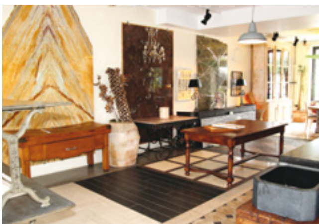
Naturstein wird in der Ausstellung des Unternehmens in Hamburg-Altona beispielhaft präsentiert.