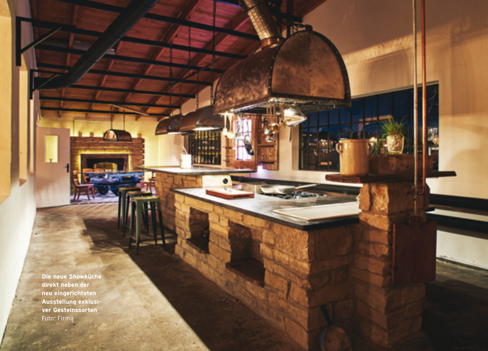
Die neue Showküche direkt neben der neu eingerichteten Ausstellung exklusiver Gesteinsorten