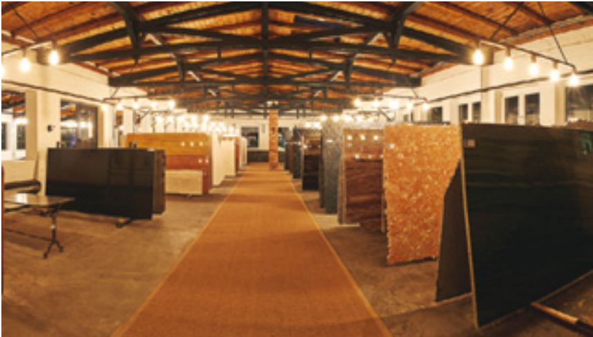
An diese neue Halle zur Präsentation exklusiver Gesteinssorten grenzt die Showküche an.