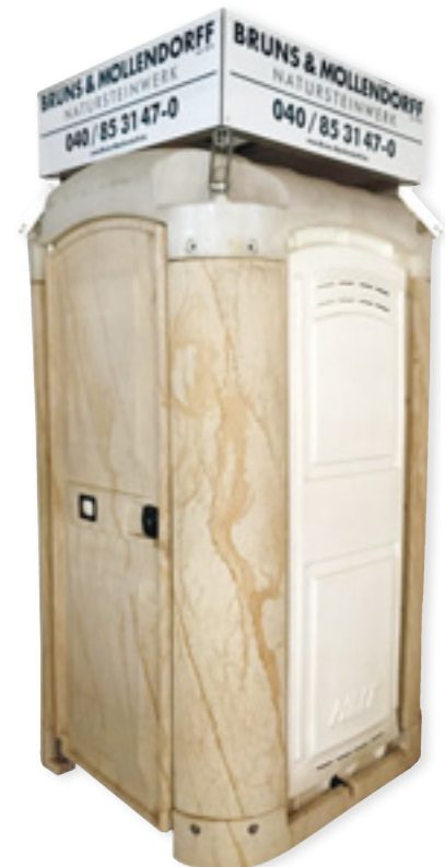
Mit Sandstein(-Tapete) bekleidete Mobiltoilette für bessere Baustellen

Bruns & Möllendorff GmbH & Co. KG Waidmannstraße 21-23 22769 Hamburg Tel. 040 853147-0 Fax 040 8501507 info@bruns-moellendorff.de www.bruns-moellendorff.de